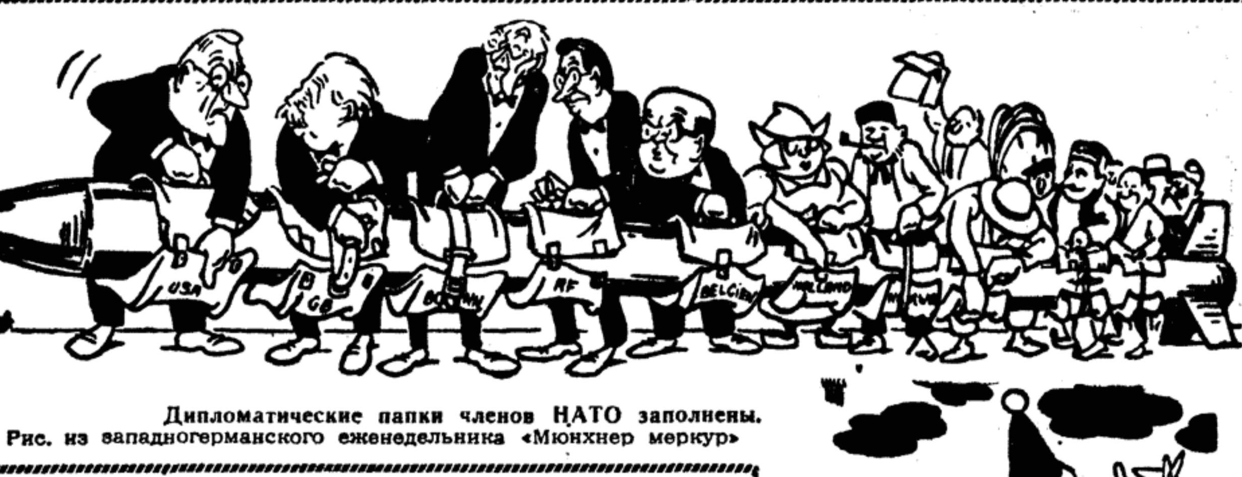
Дипломатические напки членов НАТО заполнены. Рис. из западногерманского еженедельника «Мюнхнер меркур»

«Атлантическая мишень». Англо-американские поставки оружия Тунису были расценены во Франции, как предательский удар «атлантических партнеров» во французским интересам. Рис. из французской газеты «Комба»