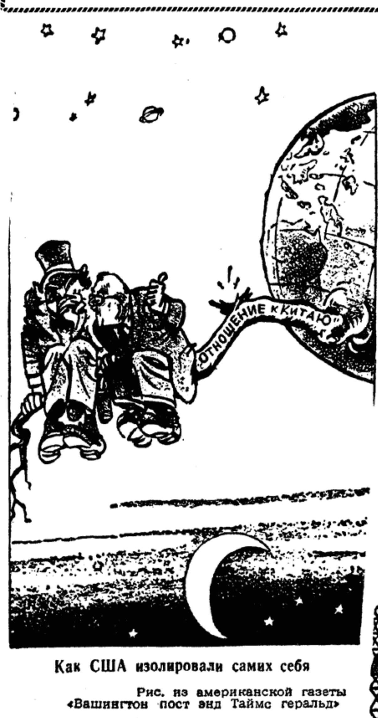
Как США изолировали самих себя Рис. из американской газеты «Вашингтон пост энд таймс геральд»