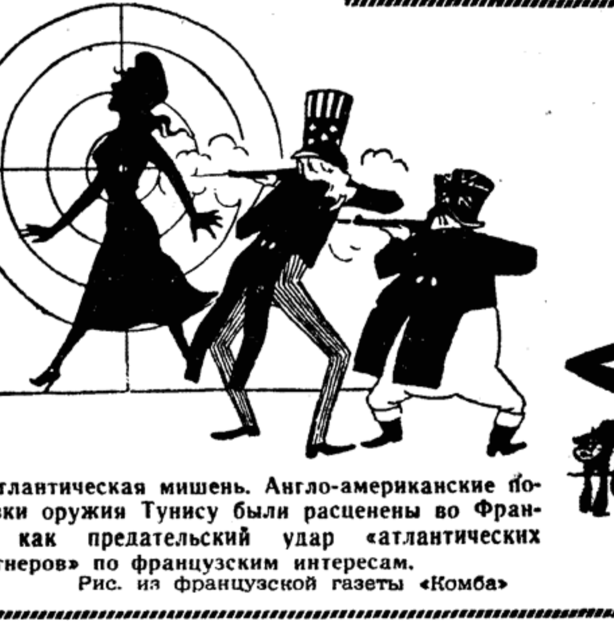
Атлантическая мишень. Англо-американские поставки оружия Тунису были расценены во Франции, как предательский удар «атлантических партнеров» во французским интересам. Рис. из французской газеты «Комба»

Ты знаешь, победо отбили мы злобой нечисти «правой» нападки Встреча тебя, наводя в дом твой частоту и порядок Хотим, чтобы садом чудесным Китая Что ста цветов ароматы всегда струились. Чтоб ты на финские пятаки в лазурь облаков свободно взлетала Мир в счастье тебе сопутствует, как на свадьбах невестам няни». С тобой труженики всех стран — нет гостей милей и желанней! Цветы в плоды наших мирных трудов — нет на свете подарков лучше! Симфонией мира и дружбы, хором могучим народов Слово «война» в языке человечества мы навсегда заглушим! Юная наша гостья, славословить не стану очень я, — Наше вдохновенье, труд энтузиазм наш увидишь сама воочию... Пробудись у нас в Китае ты всего лишь год скоротечный, Но твой священный образ в сердцах сохраним навеки мы Как памятник нерушимый весны в юности вечной Перевел с китайского А. СМЕРДОВ Народный свадебный обычай, когда няня сопровождает невесту.